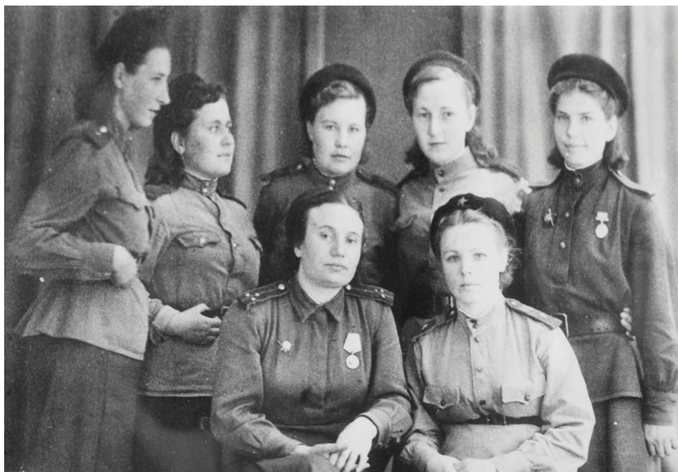
Рис. 7. Выпускницы фельдшерско-акушерской школы, участницы Великой Отечественной войны

В 1941-1942 годах в Астраханском округе было развернуто свыше 80 госпиталей, в которых астраханские медики спасли жизнь тысячам воинов.