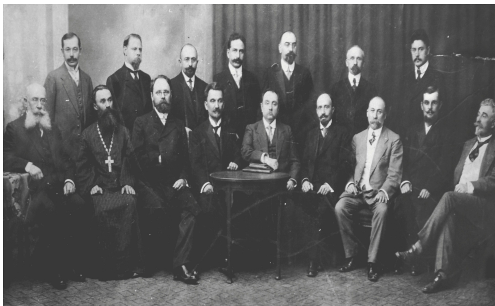
Рис. 5. Преподавательский состав фельдшерско – акушерской школы. 1913 г.

29 мая 1909 г. в школе состоялся первый выпуск - Свидетельства о звании фельдшера и фельдшерицы получили 14 человек.