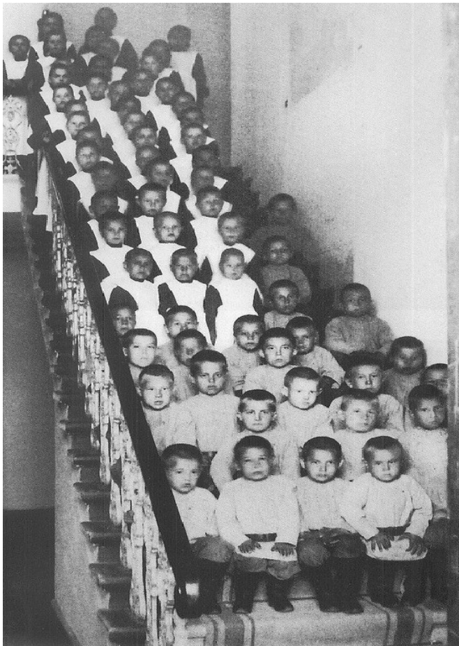
Рис. 1. Воспитанники Астраханского Елизаветинского сиротского дома [2]

Дети также обучались ремеслам. Воспитанники одевались в платье и обувь, изготовленные собственными руками.