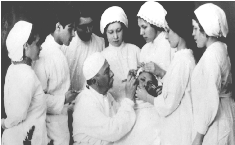
Рис. 4. Практическое занятие по отоларингологии. 1913 г.

и новорожденного ребенка в 2-х случаях родов, и сделать не менее 20 самостоятельных приемов. В мае, ежегодно, проводились испытания по всем изучаемым предметам. В результате учащиеся переводились в высший класс или же оставались на второй год. Выпускники получали Свидетельства об окончании школы, лучшие - награждались похвальными листами.