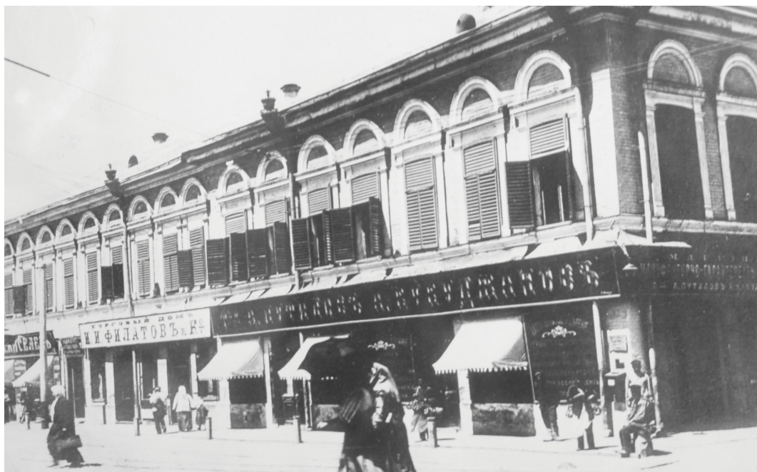
Рис. 3. Здание на углу Набережной Кутума и Ново-Исадной улицы ( ул. Ногина), где начала работу Астраханская фельдшерско-акушерская школа