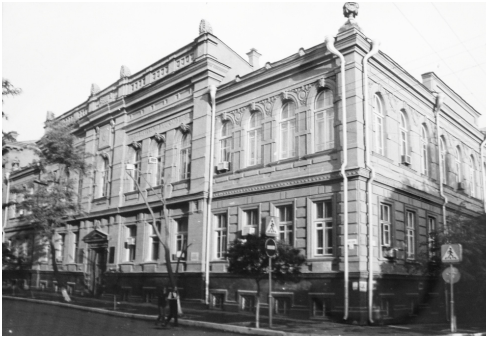
Рис. 6. Здание на ул. Советской, в котором располагался медицинский техникум

Гиппократ сказал: «Медицина есть поистине благородное из всех искусств». Вся история медицины от большой драматической до малой – есть неустанное сражение за каждую минуту жизни больного» [6].